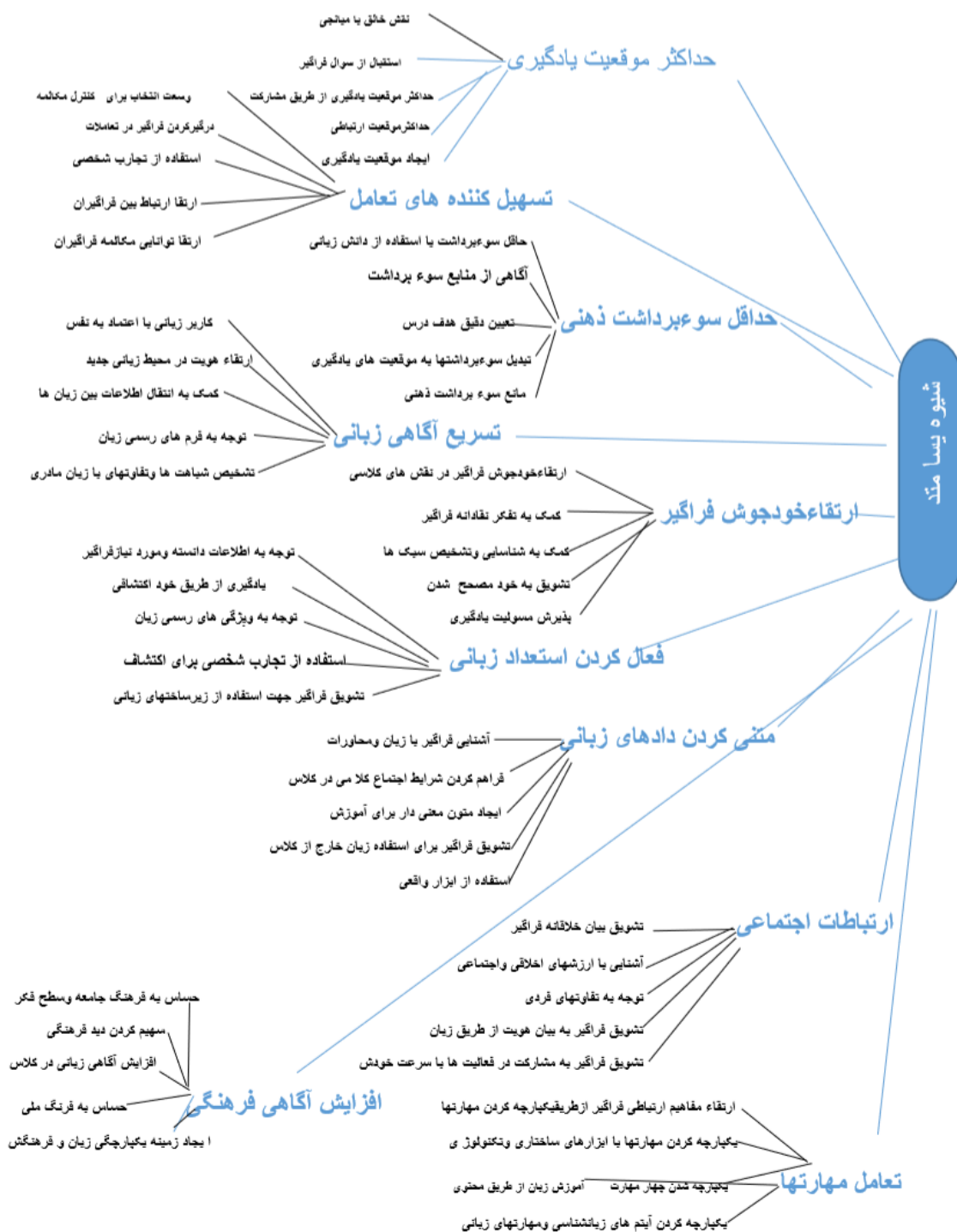
شکل (۱). نمودار درختی سلسله مراتبی AHP عوامل موثر بر پسا متد