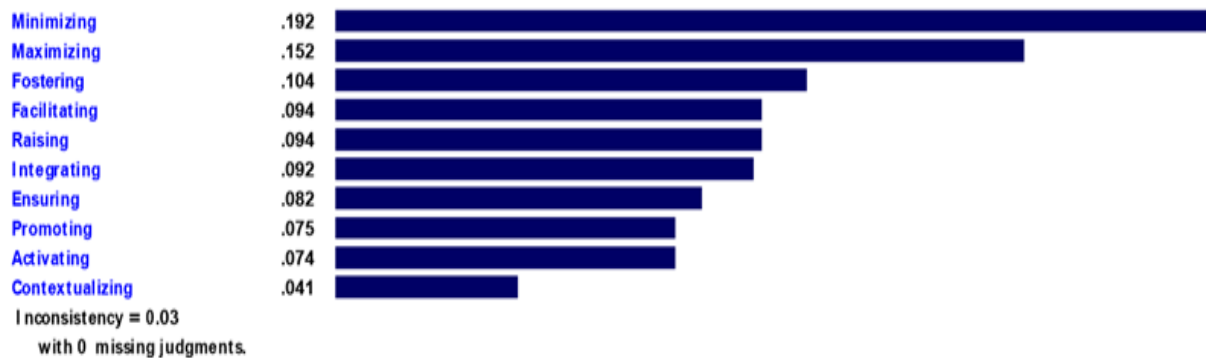
شکل (۲). نمودار وزنی ده عامل اصلی انتخاب پسامند در مدارس دولتی

Priorities with respect to: Goal: Teachers' Priorities