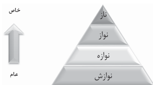
شکل ۱. هرم سلسله‌مراتبی «نوازش» تا «ناز» (برگرفته از پیش‌قدم، فیروزیان و طباطبائی، ۱۳۹۶)

از میان دیگر دستاوردهای چشمگیری که این نظریه در گستره روانشناسی با خود به همراه دارد، می‌توان به مفهوم «نوازه» ۱ به عنوان واحد اصلی اندازه‌گیری و سنجش هم‌کنشی‌های اجتماعی و یکی از مهم‌ترین عوامل ایجاد و افزایش انگیزه در افراد اشاره نمود. «نوازه» در معنای ساده و عام خود به معنای «دیده شدن توسط دیگران» دلالت دارد (برن، ۱۹۶۴). شیرای ۲ (۲۰۰۶) این مفهوم را به صورت «به رسمیت شناختن ارزش‌های دیگران» تعریف می‌کند. برن بر این باور است که «نوازه» در انسان از همان ابتدای نوزادی به عنوان یک نیاز اولیه، به دریافت نوازش و تماس فیزیکی از سوی دیگران بروز می‌کند و در روند حرکت فرد به سمت و سوی بزرگسالی، این احساس به صورت نیاز به دریافت لبخند، تعریف، تمجید، ستایش یا حتی در برخی موارد اخم یا توهین از سوی دیگران (که حاکی از به رسمیت شناخته شدن فرد توسط دیگران است) تبلور می‌یابد (استوارت و جوینز، ۱۹۸۷). بایسته یادآوری است که شماری از متخصصان روان‌شناسی و تحلیل‌گران رفتار در ایران، از این مفهوم تحت عنوان «نوازش» یاد کرده‌اند؛ اما در پژوهشی که توسط پیش‌قدم و فرخنده‌فال (۱۳۹۵) به انجام رسید، برای این مفهوم انواعی در نظر گرفته شده است؛ به طوری که برای اشاره به ابعاد فیزیکی و جسمانی این مفهوم از لفظ «نوازش»، و برای ابعاد روحی و روانی آن از اصطلاح «نوازه» استفاده شده است. به بیان دقیق‌تر، «نوازش» بر ابعاد فیزیکی و «نوازه» بر ابعاد روانی این مفهوم تأکید می‌ورزند. در همین راستا، پیش‌قدم، فیروزیان و طباطبائی (۱۳۹۶) نیز به منظور نشان دادن تفاوت میان «نوازش» و «نوازه»، هرمی سلسله‌مراتبی برای سطوح مختلف این نوع نیاز ذاتی در نظر می‌گیرند (شکل ۱).