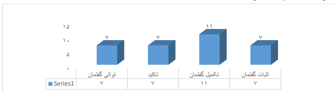
شکل ۳. عدم تغییر گفتمان‌نمای "و"

بخش دیگر یافته‌ها مربوط به عدم استفاده از رویکرد عدم انطباق یعنی عدم حذف و تغییر گفتمان‌نمای "و" در فرایند آفرینش گفتمان در ترجمه است. مطابق جدول ۱، در ۳۲ مورد یعنی ۲۶ درصد ترجمه گفتمان‌نمای "و" هیچ نوع تغییر و حذفی انجام نشده است. دلیل آن چیست؟ مطابق شکل ۳ و جدول ۵، تحلیل مثال‌ها و موارد عدم تغییر گفتمان‌نمای "و" نشان می‌دهد که دلایل چهارگانه ذیل باعث عدم تغییر آن شده است: اثبات نظر در گفتمان با ۷ نمونه و ۲۲٪ (ردیف‌های ۲ و ۶)، تکمیل محتوای واحد گفتمان با ۱۱ مثال و ۳۴٪ (ردیف‌های ۱ و ۵)، و سرانجام ۷ مورد و ۲۲٪ نیز در حوزه‌های توالی (ردیف ۴) و تاکید (ردیف‌های ۳ و ۷) در گفتمان. استفاده از این راهبردهای گفتمانی در فرایند رمزگذاری دادها در ترجمه مانع حذف یا تغییر گفتمان‌نماها در این حوزه می‌شود.