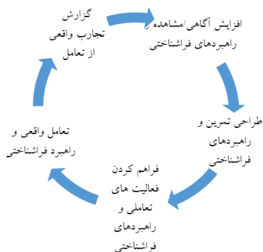
شکل شماره ۱: مدل چرخه آموزشی برگرفته از فیلیپی و روهان (۲۰۱۵)

پیش‌تر، اسکارینو و همکاران (۱۹۸۸) مدلی را برای توسعه مهارت ارتباطی زبان دوم ارائه داده بودند. در ادامه فیلیپی و روهان (۲۰۱۵) این مفاهیم را تطبیق‌سازی کردند تا آن‌را از ارتباط به‌معنای عام جدا کنند تا بتوانند فقط بر تعامل گفتاری تمرکز کنند. آن‌ها فراشناخت ۱ را به‌عنوان ویژگی اصلی و بارز آموزش صحیح مطرح کردند که در تمامی فازهای این مدل حضور دارد. آن‌ها همچنین معتقدند چنانچه ویژگی خاصی از مکالمه هنوز مشکل‌ساز است و آموخته نشده است، با بازگشت به هر یک از فازهای این مدل، می‌توان راهبردهای فراشناختی ۲ را با تعامل واقعی درهم آمیخت و آموزش داد. بنابراین فرایند برگشت‌پذیر ۳ است (فیلیپی و روهان، ۲۰۱۵). شکل زیر مدل چرخه آموزشی برگرفته از نظریه آن‌ها را که در این مطالعه استفاده شده، نشان می‌دهد.