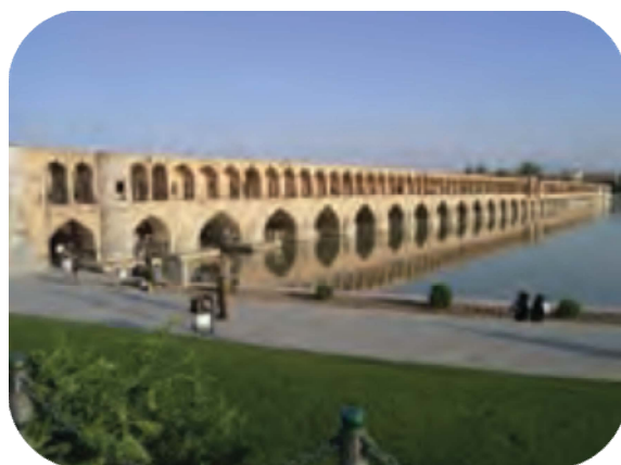
تصویر شماره ۲. نمونه‌ای از فرایند تحلیلی مفهومی (کتاب پایه هشتم، ص ۴۴).

تصاویر به‌توصیف ویژگی‌های مفاهیم ارائه شده در قالب کلمات و عبارات کمک می‌کنند.