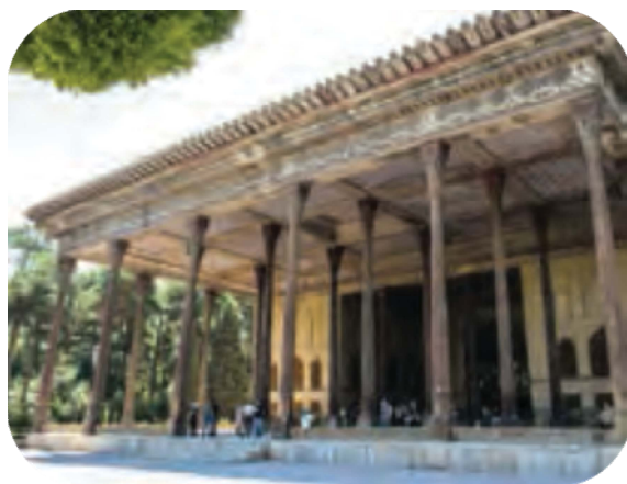
تصویر شماره ۱۴. نمونه‌ای از محیط بومی (کتاب پایه هشتم، ص ۴۲).

در تصویر شماره ۱۴ باغ‌چهل‌ستون که یکی از جاذبه‌های گردشگری شهر اصفهان است، به تصویر کشیده شده است که موقعیت شهری نامیده می‌شود. در هر سه کتاب به‌نمایش تصاویر شهری توجه شده است؛ به‌ویژه در کتاب پایه هشتم، این بعد از ارائه محیط در تصاویر بسیار دیده می‌شود. مناطق غیر بومی در تعدادی از تصاویر بررسی شده نیز دیده می‌شود. دانش‌آموزان با این تصاویر آشنایی کمتری دارند. تصاویر غیر بومی شامل محیط‌های غیرمنطقه‌ای و جهانی‌اند. همان‌طور که جدول شماره ۷ نشان می‌دهد، تعداد اندکی از تصاویر با محیط منطقه‌ای در کتاب‌های پایه هفتم و نهم به تصویر کشیده شده‌اند. برای نمونه، در تصویر شماره ۱۵ یک بنای معروف تاریخی در ترکیه را نشان می‌دهد که مثالی از تصاویر منطقه‌ای غیر بومی است. تصاویری با محیط جهانی که بتوان آن را بدون در نظر گرفتن محیط به‌مسائل جهانی ربط داد، تقریباً در هیچ یک از کتاب‌ها دیده نمی‌شود.