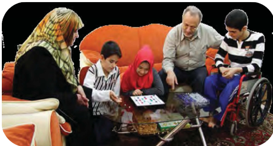
تصویر شماره ۱۱. نمونه‌ای از محیط خانواده (کتاب پایه نهم، ص ۸۹).

مادر نیز به تماشای آن‌ها نشسته‌اند. پس زمینه تصویر شامل مبلمان و میز است که موقعیت یک منزل را تداعی می‌کند. این موقعیت و محیط نشان‌دهنده یک محیط خانوادگی است. محیط خانواده در کتاب‌های پایه هفتم و هشتم کمتر از پایه نهم به تصویر کشیده‌است. در مجموع به محیط خانواده در تصاویر توجه قابل ملاحظه‌ای نشده‌است (جدول شماره ۷).