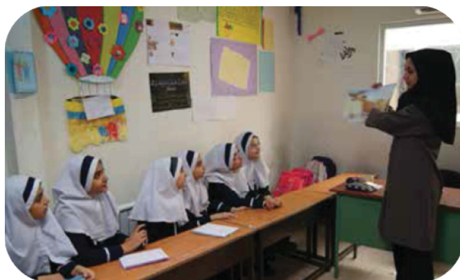
تصویر شماره ۱۲. نمونه‌ای از محیط مدرسه (کتاب پایه نهم ص ۳۴).

محیط دیگری که مورد ارزیابی قرار گرفته است، محیط جامعه است که در آن دانش‌آموزان می‌توانند سرگرمی‌ها و علائق خود را به اشتراک بگذارند. برای نمونه، تصویر شماره ۱۳ گروهی از افراد را نشان می‌دهد که به تماشای آتش‌بازی مشغول‌اند. محیط این تصویر به عنوان اجتماعی در نظر گرفته می‌شود که در آن افراد قادرند علایق خود را با یکدیگر به اشتراک بگذارند. (گو و فنگ، ۲۰۱۵). در کتاب پایه هفتم تصویری با محیط اجتماعی دیده نمی‌شود. در پایه هشتم نیز تنها دو تصویر این محیط را بازتابنده‌اند. اما در کتاب پایه نهم تاحدودی از این تصاویر استفاده شده است (جدول شماره ۷).