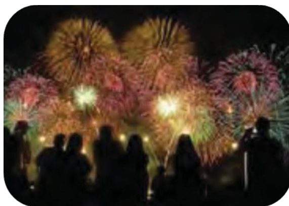
تصویر شماره ۱۳. نمونه‌ای از محیط اجتماعی (کتاب پایه نهم، ص ۵۳).

محیط دیگری که مورد ارزیابی قرار گرفته است، محیط جامعه است که در آن دانش‌آموزان می‌توانند سرگرمی‌ها و علائق خود را به اشتراک بگذارند. برای نمونه، تصویر شماره ۱۳ گروهی از افراد را نشان می‌دهد که به تماشای آتش‌بازی مشغول‌اند. محیط این تصویر به عنوان اجتماعی در نظر گرفته می‌شود که در آن افراد قادرند علایق خود را با یکدیگر به اشتراک بگذارند. (گو و فنگ، ۲۰۱۵). در کتاب پایه هفتم تصویری با محیط اجتماعی دیده نمی‌شود. در پایه هشتم نیز تنها دو تصویر این محیط را بازتابنده‌اند. اما در کتاب پایه نهم تاحدودی از این تصاویر استفاده شده است (جدول شماره ۷).