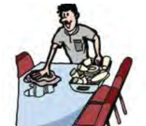
تصویر شماره ۱۰. نمونه‌ای از شخصیت‌های کارتونی ارائه شده (کتاب پایه نهم، ص ۷۸).

در کتاب پایه هفتم تقریباً هیچ تصویر کارتونی دیده نمی‌شود و در کتاب پایه هشتم تعداد اندکی از این دست وجود دارد. با این حال، در کتاب پایه نهم تا حدودی (۶,۵۲٪) به ارائه شخصیت‌های تصاویر به صورت کارتونی پرداخته شده است. در کتاب پایه هفتم همه تصاویر (۱۰۰٪) به صورت عکس واقعی‌اند. درصد بالایی از تصاویر کتاب‌های پایه هشتم (۹۸,۹۶٪) و نهم (۹۳,۴۷٪) از نوع تصاویر واقعی‌اند. تحلیل کیفی تصاویر از این جنبه نیز انجام شد. تصویر شماره ۱۰ نمونه‌ای از ارائه افراد به صورت کارتونی است. نمونه‌ای از عکس‌های واقعی را می‌توان در تصاویر شماره ۱ و ۲ مشاهده کرد.