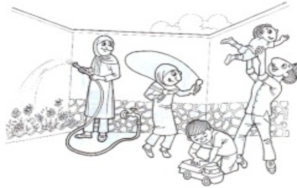
شکل ۱. تصویر تزئینی (برگرفته از کتاب Book 1 ، ۱۳۸۶: ۸)